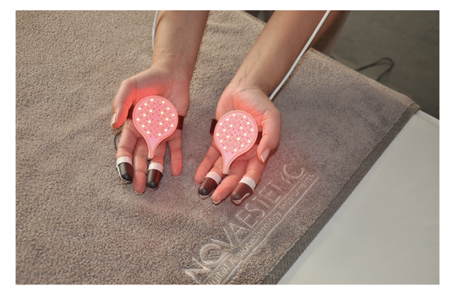
I ditali devono essere indossati sul dito indice o anulare, a seconda del tipo di programma impostato

È un trattamento estremamente piacevole: le conchiglie non si percepiscono, i ditali nemmer Quel che si sente, a fior di pelle, sono manipolazioni gentili e rilassanti. La durata del rituale cambia a seconda della zona su cui interviene: 50 minuti la sessione per il corpo, poco meno per il viso che tuttavia viene trattato come una prima fase esfoliante e l'applicazione finale di soin rivitalizzanti.